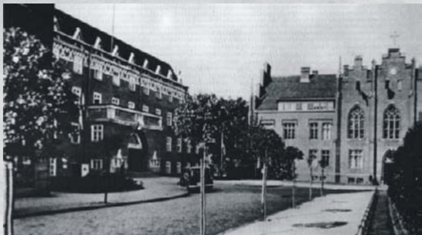
Adolf Hitler Platz, po lewej ratusz, w głębi gimnazjum, lata 30. XX wieku.