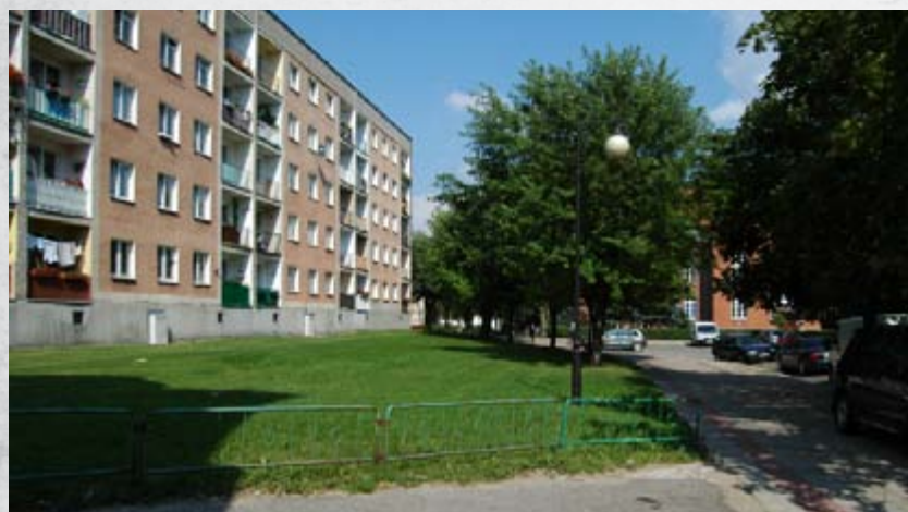
Ulica Roosevelta współcześnie.