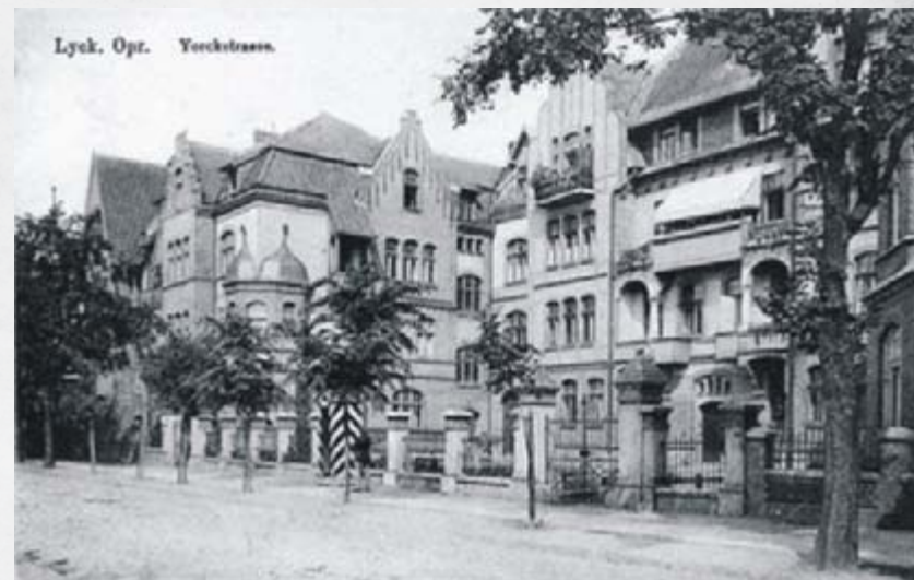
Kamienica przy Yorkstrasse, widok z 1914 roku.

Następnie władze miejskie przeprowadziły się do zabytkowej kamienicy przy ul. Kościuszki 9. Po wyprowadzce władz miasta w zajmowanych pomieszczeniach zorganizowano tzw. szkołę handlową, a po utworzeniu diecezji Ełckiej powołano w niej Wyższe Seminarium Duchowne.