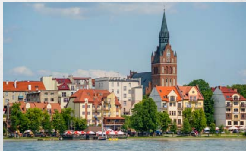
Aktualna panorama Ełku.