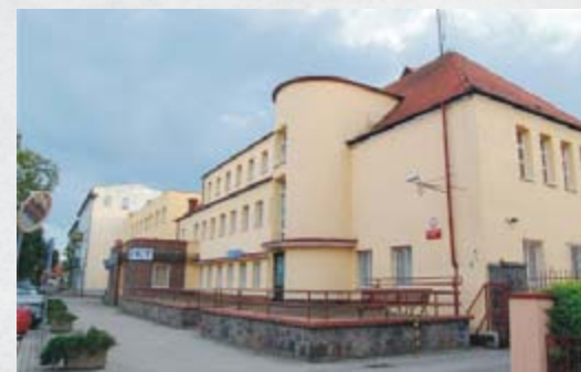
Pierwsza powojenna siedziba władz miejskich, ul. Chopina 10, widok współczesny.

Pierwszą powojenną siedzibą polskich władz miejskich był budynek przy ul. Chopina 10 (obecnie Komenda Powiatowa Policji). Nie trwało to jednak długo, ponieważ po wielokrotnych naciskach, 22 maja 1950 roku, Prezydium Miejskiej Rady Narodowej odstąpiło Powiatowemu Urzędowi Bezpieczeństwa Publicznego dotychczas zajmowany gmach.