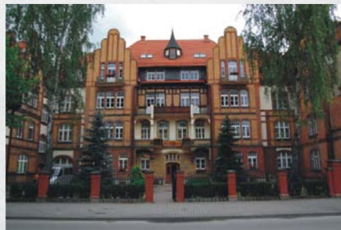
Zabytkowa kamienica przy ul. Kościuszki 9, widok współczesny.