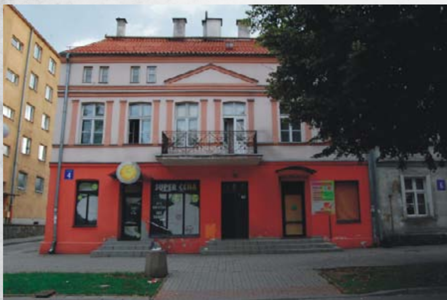
Klasycystyczna kamienica przy ul. 3 Maja 4, widok współczesny.

Następnie władze miejskie przeprowadziły się do zabytkowej kamienicy przy ul. Kościuszki 9. Po wyprowadzce władz miasta w zajmowanych pomieszczeniach zorganizowano tzw. szkołę handlową, a po utworzeniu diecezji Ełckiej powołano w niej Wyższe Seminarium Duchowne.