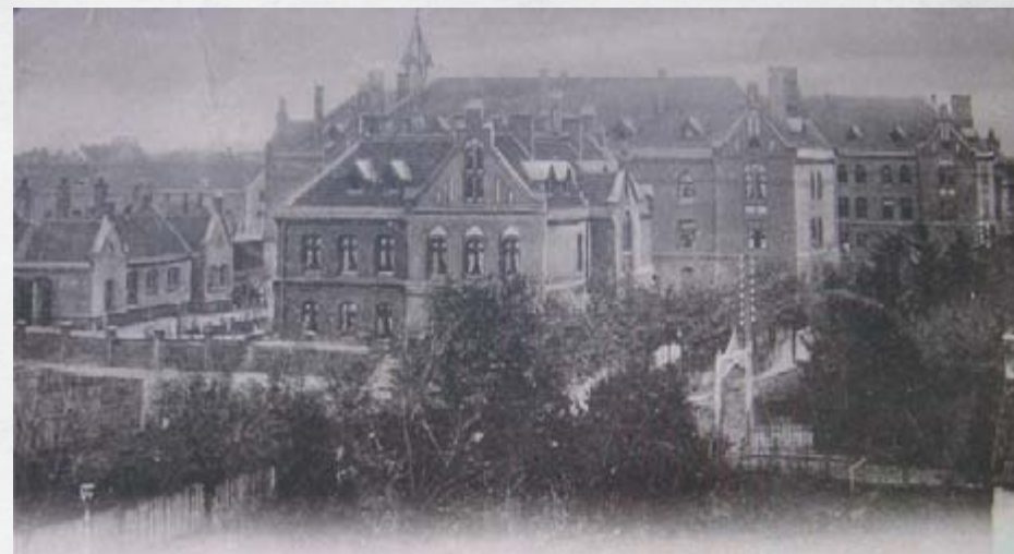
Yorkstrasse, około 1920 roku, widok na budynki koszar.

Postanowiono, że w międzyczasie władze przeprowadzą się do jednego z pokoszarowych pawilonów przy Yorkstrasse (obecnie ul. Kościuszki). Czasowo siedziba magistratu znajdowała się naprzeciwko kasyna garnizonowego.