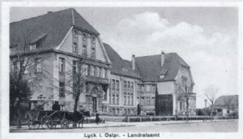
Widok gmachu Starostwa przy Schulstrasse z 1912 roku.

I tak zawiła historia największego miasta na Mazurach sprawiła, że pomimo wielowiekowej tradycji nie może pochwalić się ono przed turystą kilkusetletnim budynkiem ratusza w samym sercu starówki, jednak może stanowić to przyczynek do ciekawego spaceru odkrywając raz po raz tajemnice fasad stylowych kamienic i miejsc związanych ze sprawowaniem władzy nad Ziemią Ełcką.