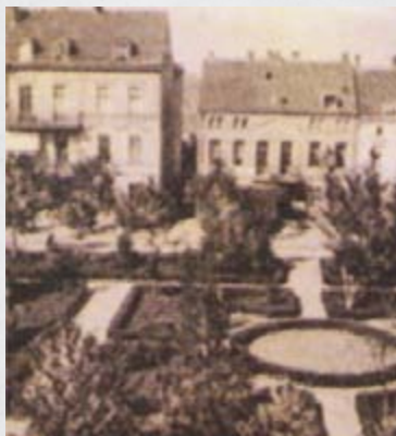
Widok na Park Luizy, w głębi kamienice, widok z początku XX wieku.

Władze podjęły starania o uzyskanie lokalu zastępczego. Nową siedzibą magistratu została klasycystyczna kamienica przy ul. 1-Maja (obecnie ul. 3-Maja 4) w samym centrum ówczesnego Ełku. Budynek ten znajduje się tuż przy XIX - wiecznym parku miejskim (niegdyś Park Luizy, obecnie Park Solidarności). W późniejszych latach pełnił on różne funkcje m.in. znajdowała się w nim Centrala Rybna, dziś - mieszkania i lokale usługowe.