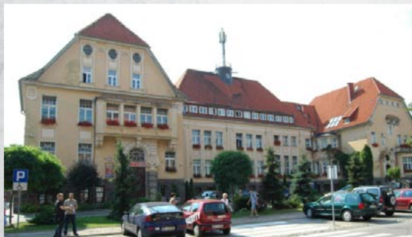
Budynek Urzędu Miasta i Starostwa Powiatowego w Ełku przy ul. Piłsudskiego 4, widok współczesny.