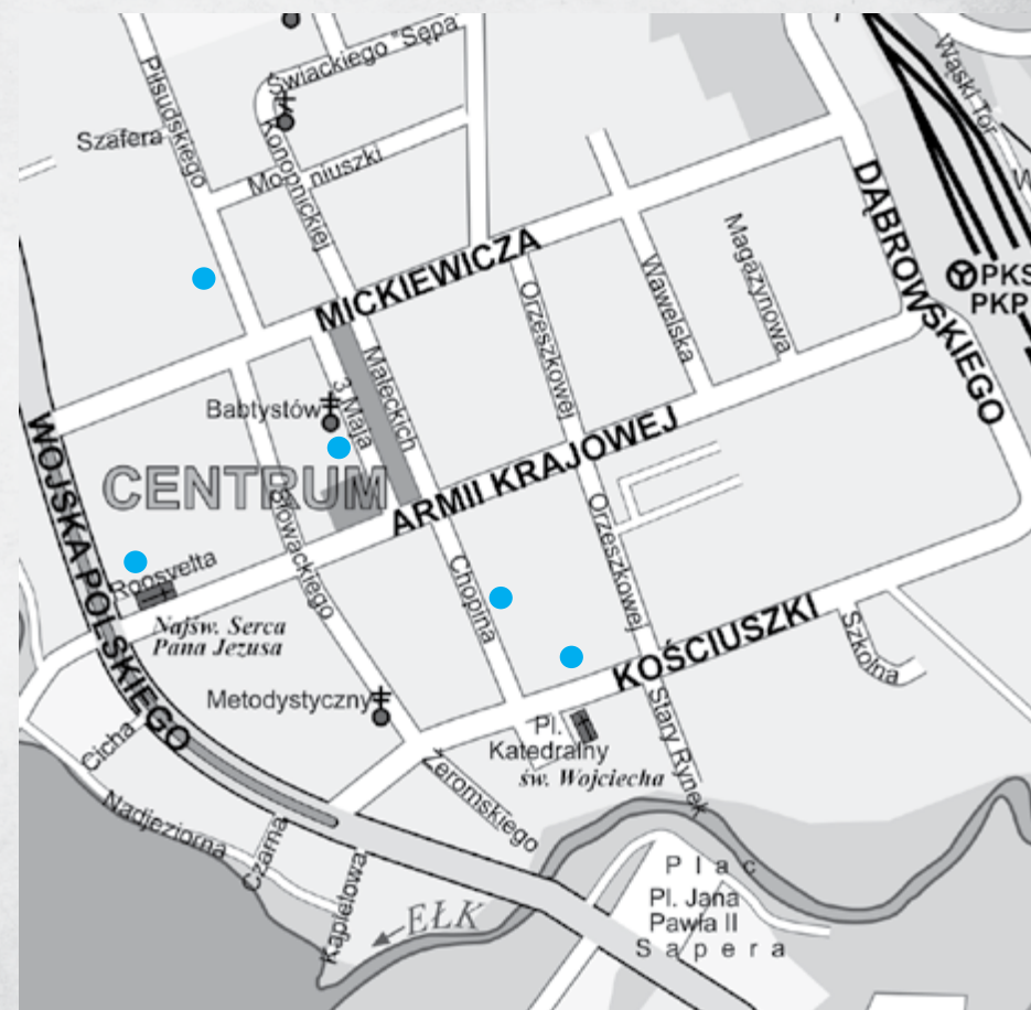
● lokalizacje opisanych w przewodniku siedzib władz miejskich