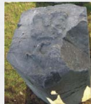
Kamień herbowy znad drzwi wejściowych do ratusza przy A.H. Platz.

Wybuchła II Wojna Światowa, która nie oszczędzała ani ludzi, ani budynków. W czasie wojny w ratuszu znajdowała się siedziba i więzienie gestapo, a pierwsi mieszkańcy polskiego Ełku wspominają ściany piwnic zlane ludzką krwią. 21 stycznia 1945 roku zarząd miasta otrzymał rozkaz ewakuacji. Ratusz został spalony przez wojsko radzieckie, a pozostałości po nim przeznaczono na odbudowę innych obiektów. Jedynym śladem, oprócz fotografii, jest kamień herbowy znad drzwi wejściowych, który obecnie można zobaczyć przy Wieży Ciśnień w Ełku.