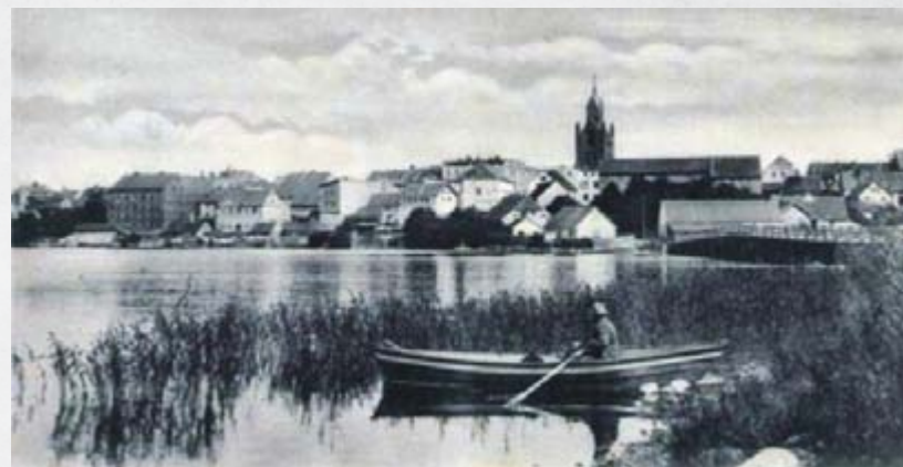
Widok na Lyck z wyspy zamkowej, koniec XIX wieku.

W niniejszym opracowaniu chcielibyśmy przybliżyć współczesnym mieszkańcom Ełku i ich gościom, jak wyglądał Ełk kilkadziesiąt, a nawet kilkaset lat temu; jakie funkcje pełniły niegdyś budynki, które zachowały się do dziś, a także przypomnieć, że tam gdzie dziś stoją nowe bloki, kiedyś istniały zupełnie inne gmachy. Chcielibyśmy aby spacer po Ełku śladami dawnych budynków władz miejskich był ciekawym sposobem na poznanie fragmentu zawiłej historii miasta.